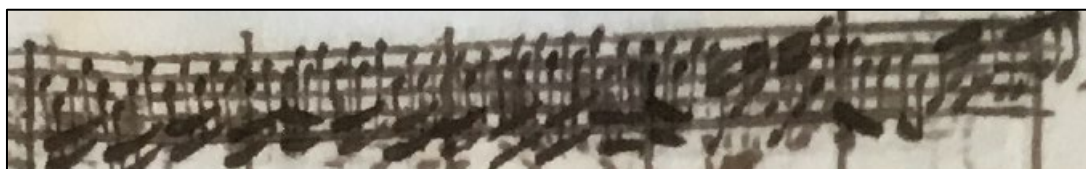
Ejemplos de más de 5 líneas en el pentagrama y de degradación general de la tinta

tradicionales de la misa, en esta partitura falta el Agnus, pero no parece que esté perdido, sino que no fue musicado. Por una parte, el final del Sanctus no coincide con el final de página, por lo que el comienzo del Agnus debería figurar en el sistema siguiente, como ocurre con los inicios del Gloria, Credo y del propio Sanctus. Por otra, sorprende la brevedad del Sanctus, apenas 25 compases, si la comparamos con la longitud de las partes previas (160, 324 y 316 respectivamente para Kyrie, Gloria y Credo), dato que posiblemente nos esté indicando que el autor por razones que desconocemos aceleró su final y la terminó antes de lo que hubiera deseado.